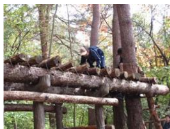
3年生・冒険ハイク

今年度から2年生と4年生の宿泊研修に加え、集団の在り方などを宿泊研修で学ぶために1年生、3年生でも宿泊研修を実施することとしました。2年生と4年生は例年通り、関西研修旅行とオーストラリアの研修旅行を実施しました。1年生は御殿場にある国立中央青少年交流の家で宿泊研修を実施し、集団生活と班行動を通して、自主的に責任をもった行動ができるように取り組みました。3年生は山梨県立八ヶ岳少年自然の家で宿泊研修を実施し、非日常的な体験や集団行動を通じて自然への畏敬や食に対する感謝の気持ちを学んだり、協力や協働する態度を身に付けたりすること等を目的として取り組みました。来年度は、1年生から4年生までの宿泊研修に加え、5年生でも宿泊の行事を予定しています。学校では、このような取組から、力強い南多摩生を育成しています。