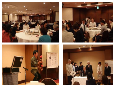
平成29年度の定期総会・懇親会

同窓会総会は、現在の母校を知る機会であり、また、共に学んだ仲間との再会、年齢を越えた先輩や後輩の新たな出逢いの場でもあります。同級生、クラブ活動を共にした仲間等と誘い合っご参加ください。懇親会に参加される方は、事前の申込みをお願いします。