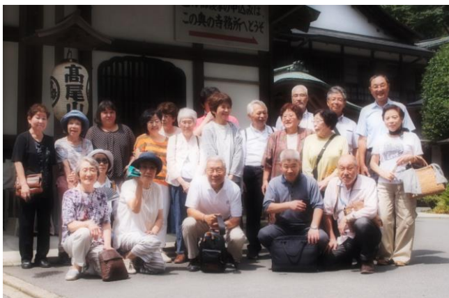
納涼会参加者集合写真