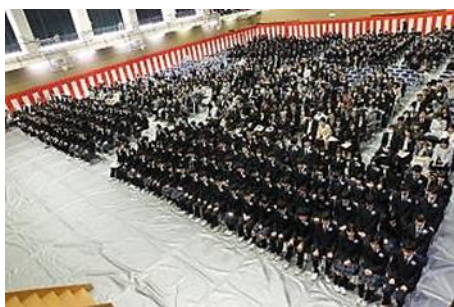
第3回卒業式の様子

あかね会の皆様、いつもお世話になりありがとうございます。南多摩中等教育学校となり9年目を迎え、学校は創成期から成熟期への時期に差し掛かっています。本校の現状をお伝えし本校の取組について御理解をいただき、本校の一層の発展に向けて、今後もあかね会の皆様の御支援をいただければ幸いです。