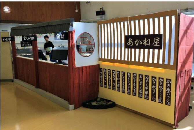
「あかね屋」店舗外観

卒業生の出店には『卒業生がもう一度母校で一堂に会し、仲間と文化祭を楽しむ』という目的のほかに『在校生の団体のみでは応えきれない昼食需要に応え、在校生とともに文化祭を盛り上げる』という目的がありました。そのため出店に当たってはそれらを達成することを念頭に置き、例えば在校生では必須となっている食券制を廃して自作のレジスタを導入するなど、店の回転をあげてより多くのお客さんに来ていただけるような工夫をこらしました。また仕入れの手配や資金の面でも、在校生には規則上難しい点をあかね会の皆様のご協力のもとで積極的にカバーし、卒業生の立場をいかした文化祭への貢献を第一に企画を練っていきました。