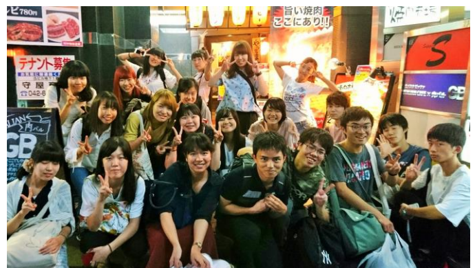
飲食出店の参加者

最後になりましたが、今回の出店には大勢の方のお力添えを頂きました。皆様のご協力なしには到底出店までこぎ着けなかったと思っています。あかね会の皆様、在校生の実行委員や生徒部の先生方、購買部の皆様、そして7年目の文化祭に参加してくれたたくさんの有志のみんなと、一緒に代表を務めてくれた3人に、この場をお借りして御礼申し上げます。ありがとうございました。