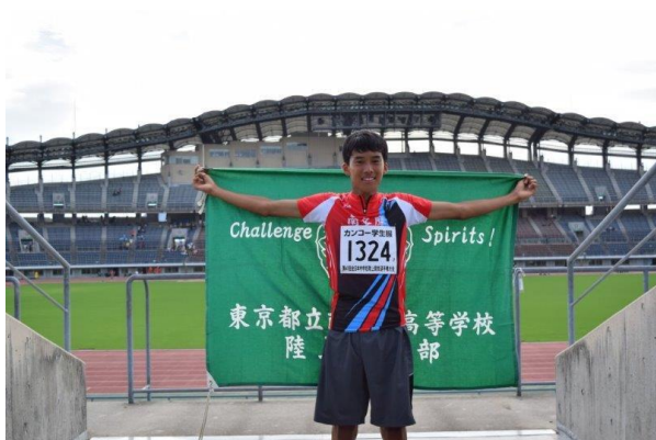
自身初となる全国大会で見事に優勝した