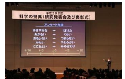
プレゼンテーション発表

の祭典」（研究発表会および表彰式）が東京ビッグサイトで開催され、ポスター発表に5年生の2名が「ストームグラスと南極石の研究～高校化学で天気予報～」という内容で発表しました。プレゼンテーション発表では、5年生の別の生徒が「What is a short melody attracting people ～人を引き付ける短いメロディとは何か～」というテーマで英語による発表をしました。高校生を対象