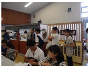
中等教育学校2期生による飲食店「あかね屋」

東館1階ランチルームの「あかね屋」では、本年の卒業生がおにぎり・冷やし中華のほか、飲み物やかき氷などを販売し、人の列が絶えませんでした。