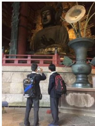
2年生・東大寺奈良の 大仏見学

今年度から2年生と4年生の宿泊研修に加え、集団の在り方などを宿泊研修で学ぶために1年生、3年生でも宿泊研修を実施することとしました。2年生と4年生は例年通り、関西研修旅行とオーストラリアの研修旅行を実施しました。1年生は御殿場にある国立中央青少年交流の家で宿泊研修を実施し、集団生活と班行動を通して、自主的に責任をもった行動ができるように取り組みました。3年生は山梨県立八ヶ岳少年自然の家で宿泊研修を実施し、非日常的な体験や集団行動を通じて自然への畏敬や食に対する感謝の気持ちを学んだり、協力や協働する態度を身に付けたりすること等を目的として取り組みました。来年度は、1年生から4年生までの宿泊研修に加え、5年生でも宿泊の行事を予定しています。学校では、このような取組から、力強い南多摩生を育成しています。