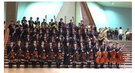
南多摩フィルハーモニー部・ 全国大会グランドコンテスト

「太鼓の甲子園（全国大会）」に太鼓部が初めて参加しました。8月には、「全国高等学校総合体育大会なぎなた競技大会」に6年生と4年生の2名が出場し、「全国中学校陸上競技大会」に3年生男子が走幅跳に2年生女子が200mに出場しました。11月には、南多摩フィルハーモニー部が千葉県文化会館で開催された「日本学校合奏コンクール2017全国大会グランドコンテスト」に出場し、銅賞を獲得しました。南多摩フィルハーモニー部は12月に高校オーケストラの祭典である「全国高等学校選抜オーケストラフェスタ」にも参加しました。3月には、なぎなた部が「全国高等学校なぎなた選抜大会」に団体で出場し、入賞手前のベスト16まで進出しました。今後もすべての部活動の応援をよろしくお願いします。