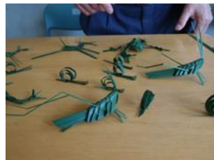
シュロによる作品

東館1階ランチルームの「あかね屋」では、本年の卒業生がおにぎり・冷やし中華のほか、飲み物やかき氷などを販売し、人の列が絶えませんでした。