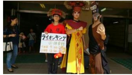
文化祭・演劇の広報の様子

方々も多くいらしたと思いますが、皆様に満足いただける圧巻の舞台等だったと思います。是非、来年度もおいでいただければ幸いです。