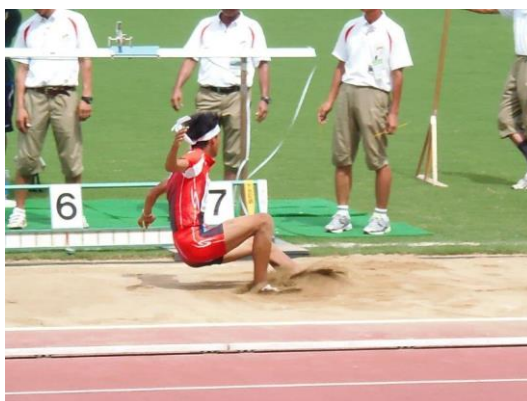
優勝を決めた決勝6回目の跳躍