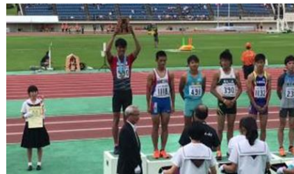
6年酒井君・インターハイ 男子走幅跳優勝

スカイプチャットによる交流は、本校の教育活動に新しい1ページを加える取組となりました。また、インドのビラボーンハイインターナシ