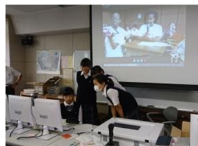
スカイプチャットの様子

授業以外の取組の一つに、今年度から始まったグローバルスカラーズのスカイプチャットによる交流があります。スカイプチャットとは、チャットを用いた海外の学生との同時双方向の英会話学習です。日本でのグローバルスカラーズへの参加は本校が初めてで、本校が日本を代表する形になっています。この取組ではアメリカ、スペイン、インド、イスラエル等の学校と交流しました。IT技術の進歩により、学校にいながら外国の学校との交流ができるようになったことは、英語活用のチャンスがふえただけでなく、国際感覚を磨くチャンスも増えたこととなります。