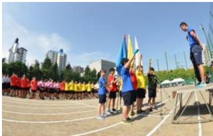
体育祭・団長による宣誓の様子

「体育祭」では、白団・黄団・赤団・青団の(1年～6年の縦割)4団による団対抗戦で行われます。12歳から18歳までの異年齢の集団によって繰り広げられ、体格の違いから最も中等教育学校の特色が濃く出る学校行事ですが、上級生は下級生をよく面倒をみています。「合唱祭」は、例年通りオリンパスホール八王子