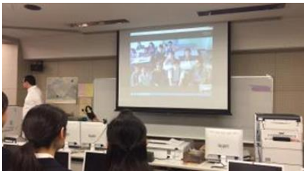
ビラボーンハイインターナショナル スクールとの交流

ビラボーンハイインターナショナルスクールとのスカイプチャットの交流では、今後も継続的に交流を進めていく協定（フレンドシップ校としての協定）を結びました。