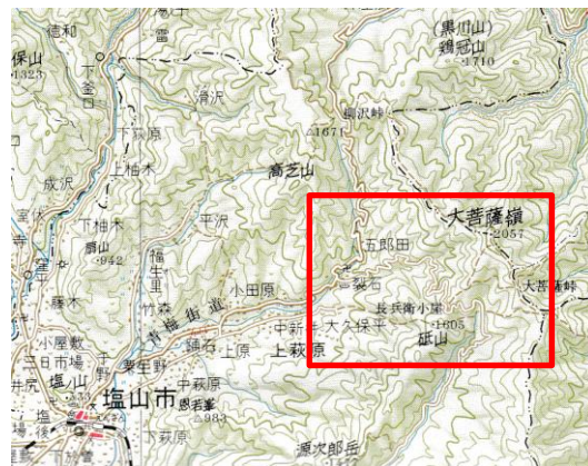
大菩薩峠登山ルート (1/200,000地勢図「甲府」昭和55年) (赤枠が左図の範囲)