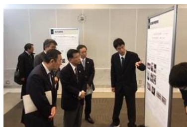
教育長や教育監の方々への ポスター発表

例年通り各種コンテスト等への参加も盛んです。「高校生言葉の祭典」は、「都立高校生プレゼンテーションコンテスト」と「高校生書評合戦東京都大会の決勝」として開かれます。本校からは両方に参加し、「高校生書評合戦東京都大会の決勝」では見事に優秀賞を受賞しました。「科学