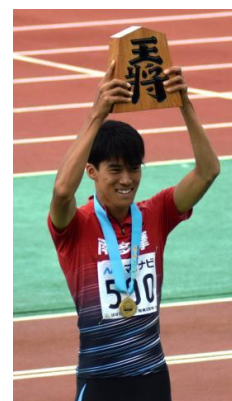
昨年のインターハイ表彰式の様子